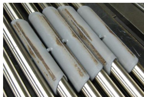
クリーニングゴムに付着した汚れ